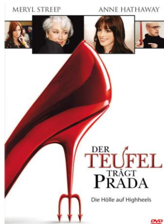
Filmplakat eines Films von 2006