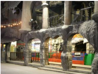
Geisterbahn auf dem Jahrmarkt